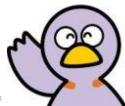
埼玉県マスコット コバトン